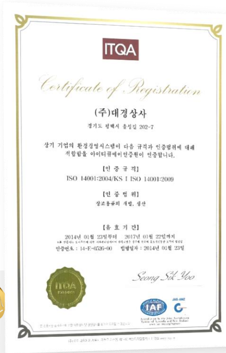
ISO 14001 공장 환경경영시스템 인증