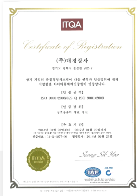
ISO 9001 공장 환경경영시스템 인증